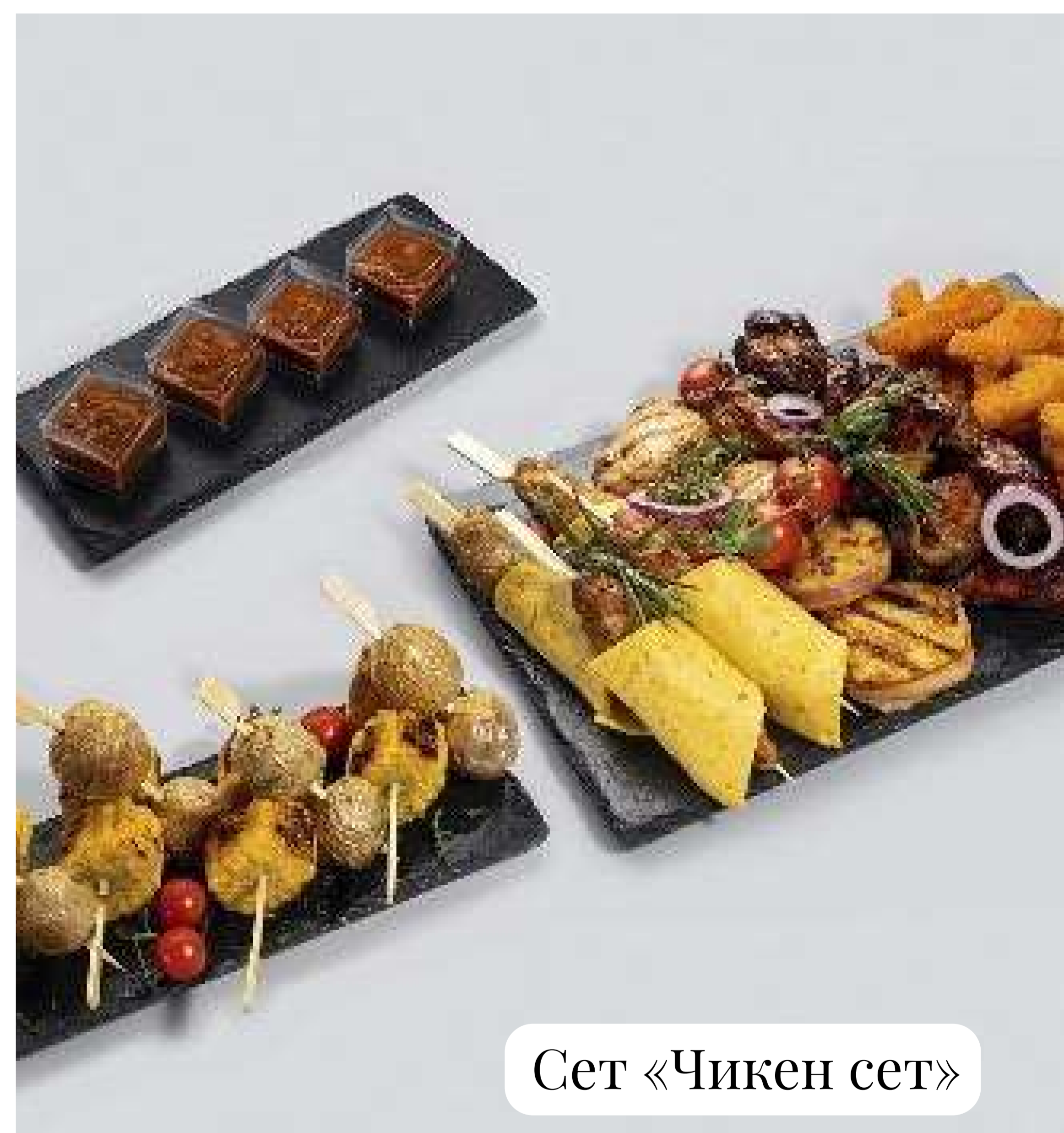
Сет «Чикен сет»