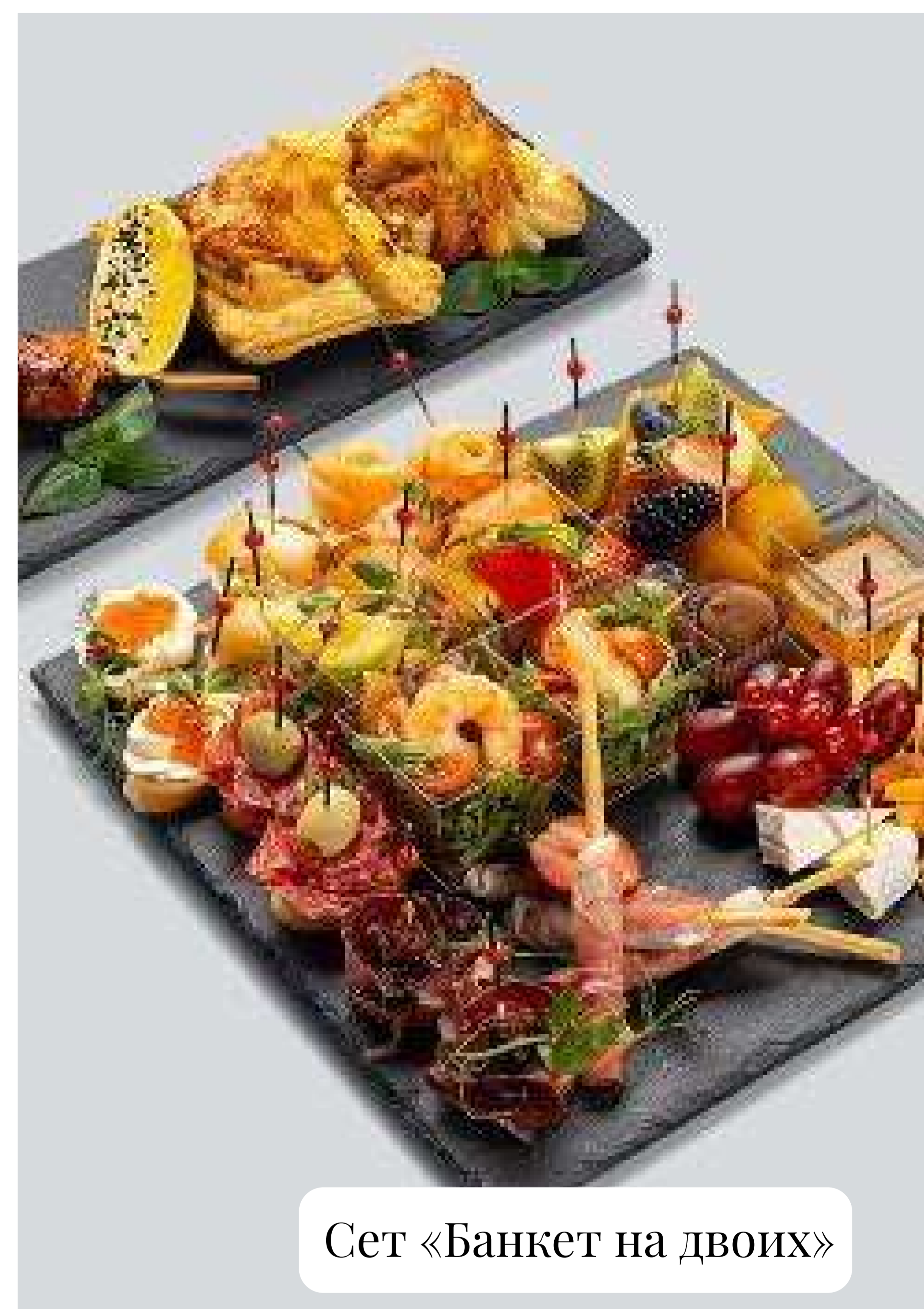
Сет «Банкет на двоих»