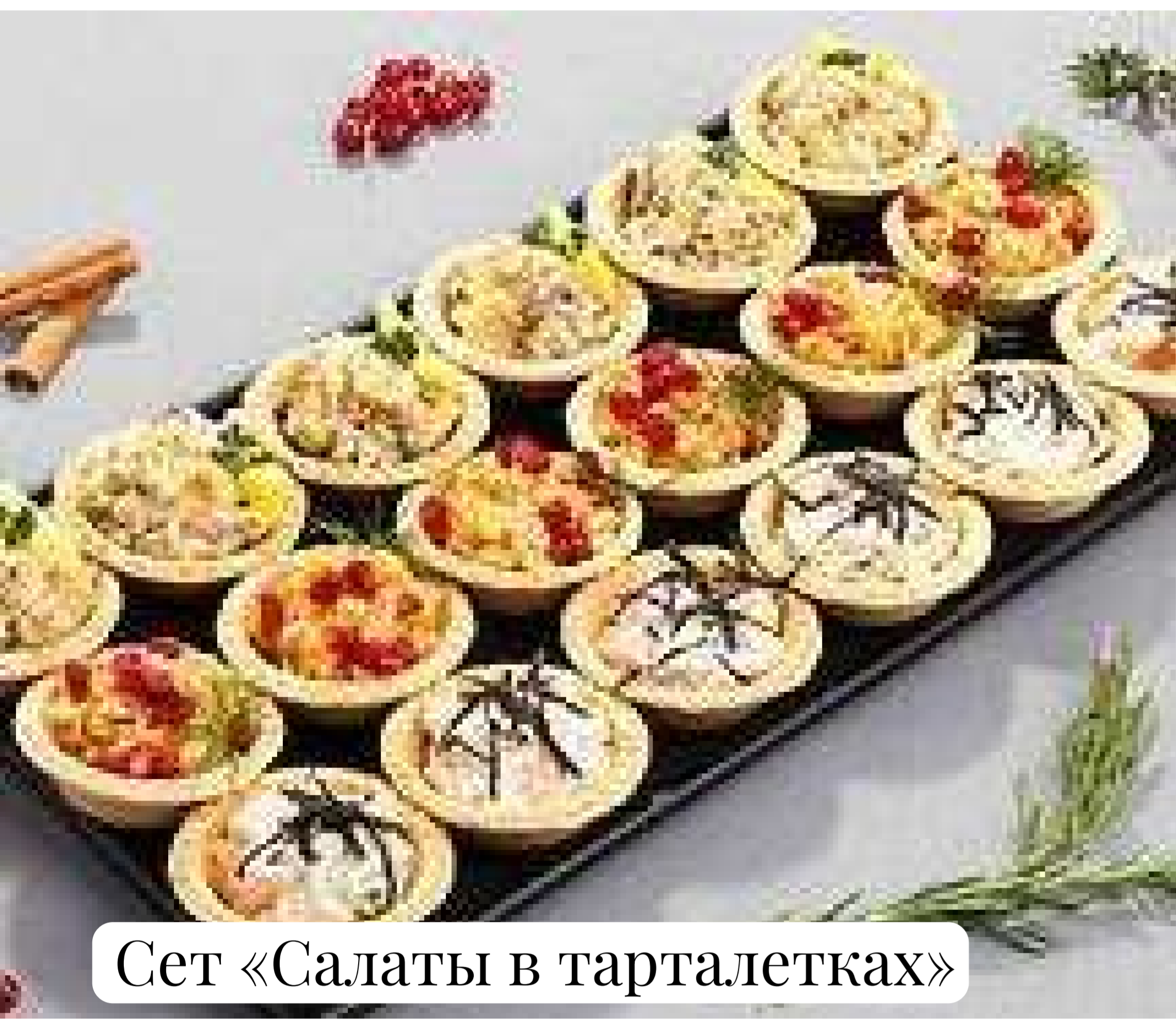
Сет «Салаты в тарталетках»