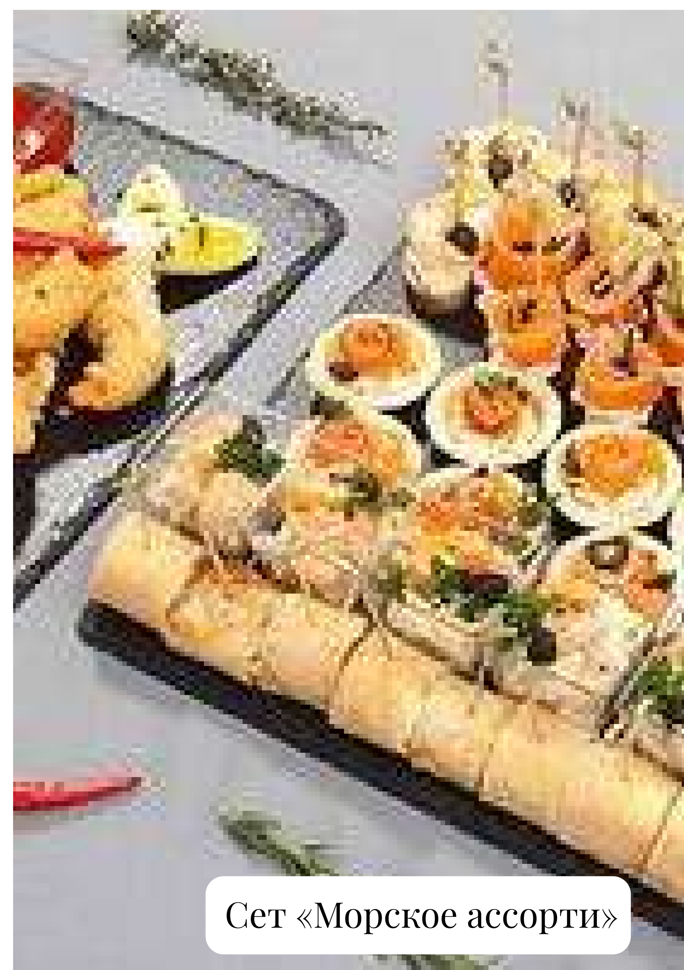
Сет «Морское ассорти»