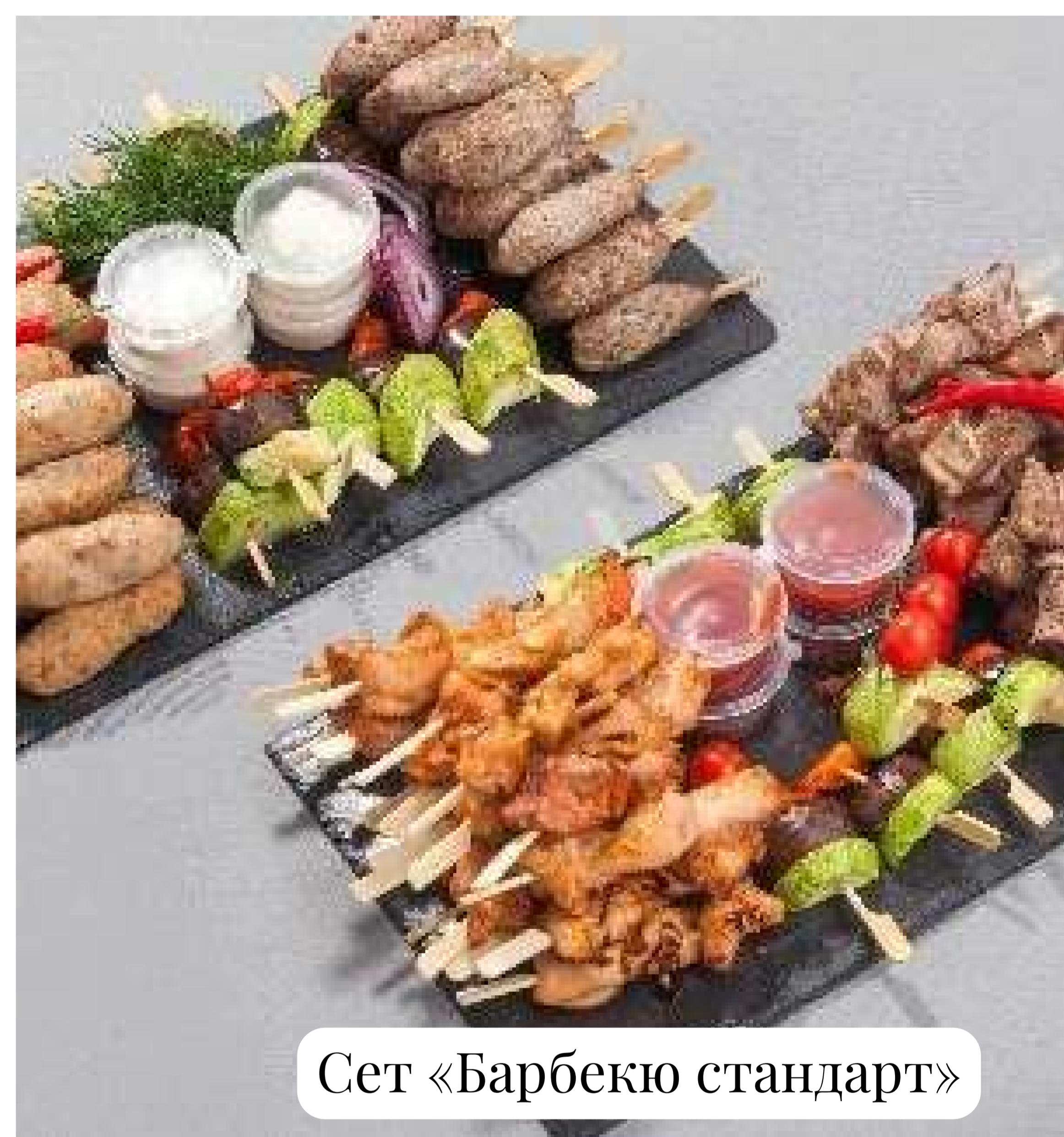
Сет «Барбекю стандарт»