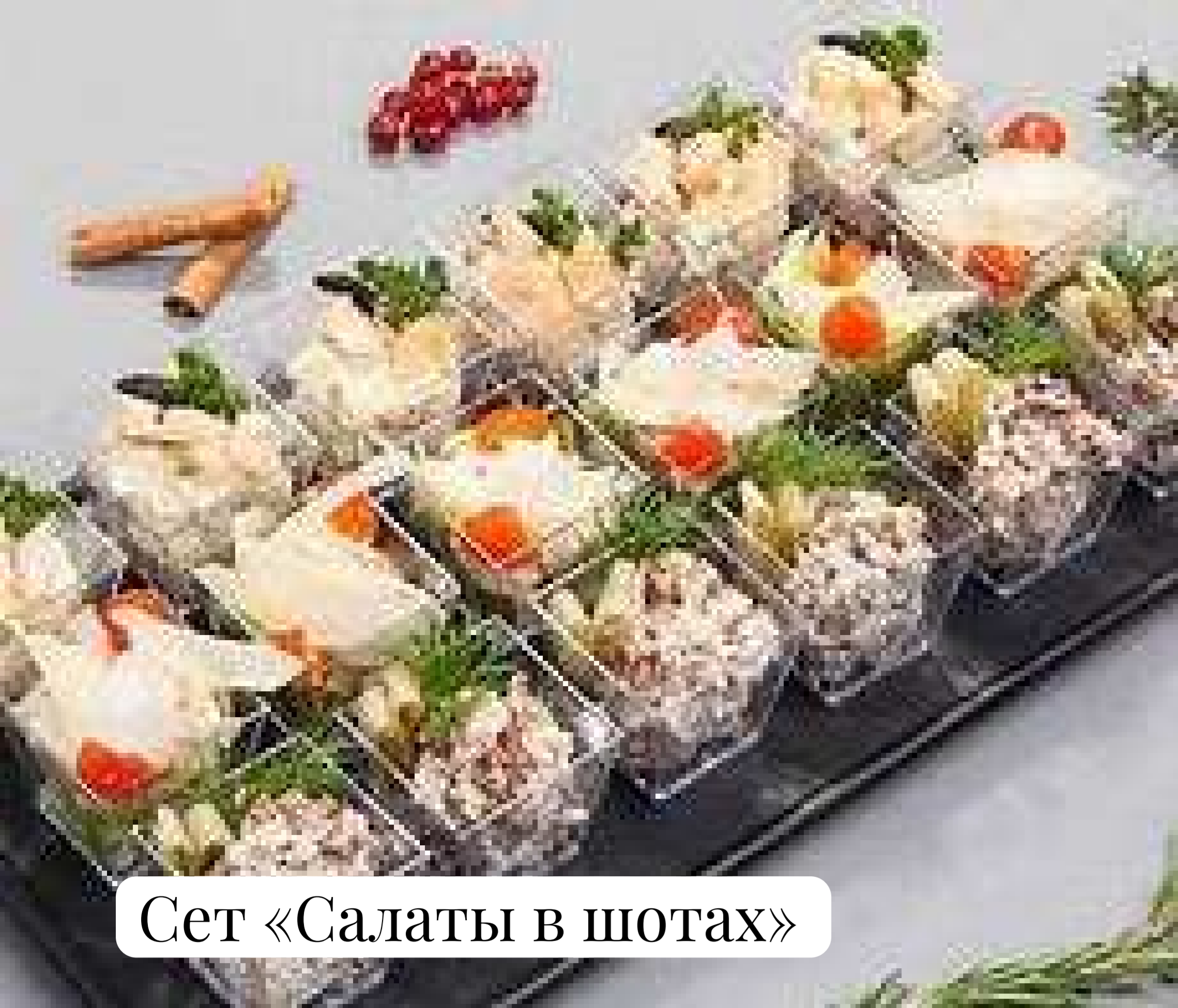
Сет «Салаты в шотах»